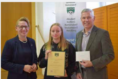
Jovic Isidora Musikabzeichen Bronze – Violine