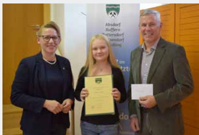
Harold Sophia Musikabzeichen Bronze – Querflöte