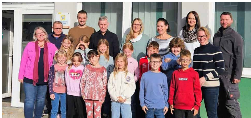
Foto: GemeindemitarbeiterInnen sowie Lehrkräfte der Volksschule mit der 3. Klasse Statzendorf

Im Zuge des Sachunterrichts konnten sich die Schülerinnen und Schüler der 3. Klasse bereits einiges Wissen über ihren Heimatort Statzendorf aneignen. Vor den Herbstferien durften die Kinder dann das Gemeindeamt besuchen, wo sie sich über die Arbeit des Bürgermeisters und der Gemeindebediensteten vor Ort einen Überblick verschafften. Eine Jause im Sitzungssaal bildete den Abschluss des gelungenen Lehrausgangs.