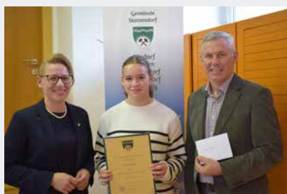
Zagler Maja Musikabzeichen Silber – Klarinette