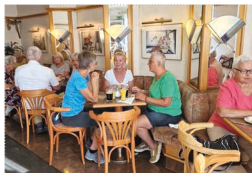
Monatlicher Frühstückstreff in der Konditorei Fuchs in Statzendorf, jeweils mit vollem Haus.