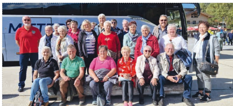
4-Tagesausflug nach Innsbruck mit vielen Besichtigungen.