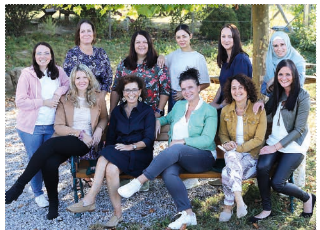
TEAM DER VOLKSSCHULE