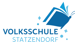
Das neue Logo der Volksschule Statzendorf