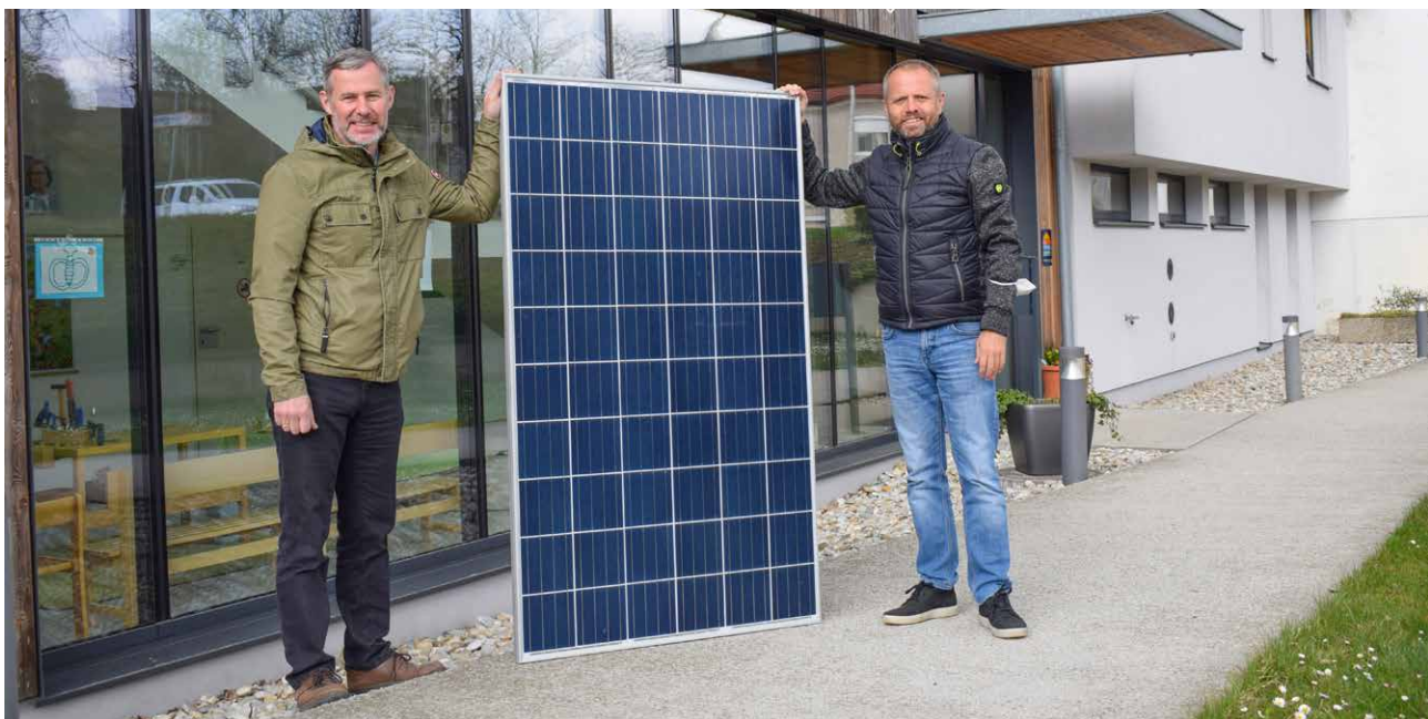
© Modellregion Unteres Traisental - Fladnitztal