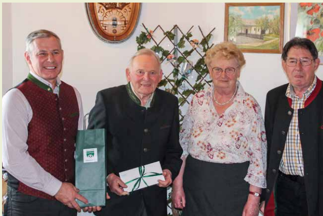
Anton Bauer zum 80. Geburtstag