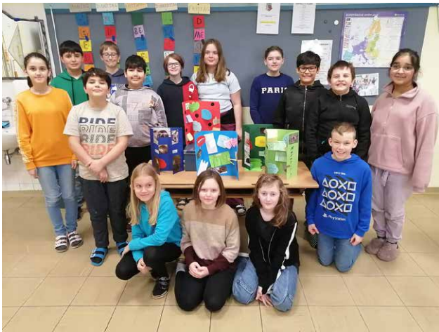
Die SchülerInnen der 1a präsentieren stolz ihre „Lapbooks“

Fähigkeiten und Fertigkeiten weiterentwickeln und stärken – das war das Ziel der Schwerpunktwoche der Sportmittelschule Wölbling. Während in den ersten Klassen das Augenmerk auf Selbstorganisation und dem Strukturieren von Informationen lag, lernten die SchülerInnen der zweiten Klassen ihre Lern-typen kennen. Gewaltfreie Kommunikation und Stärkung der Klassengemeinschaft waren die Themen in den dritten Klassen. Die vierten Klassen widmeten sich der Kommunikation, um auch schon für Vorstellungsgespräche gerüstet zu sein. Mit den Projekttagen soll das „Lernen fürs Leben“ im Vordergrund stehen und Schwerpunkte im Schuljahr gesetzt werden.